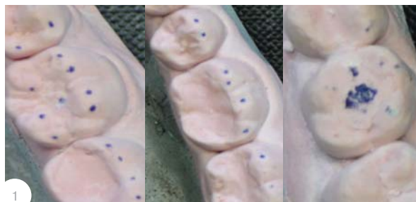
Рис. 1. Варианты окклюзионных нарушений зубных рядов у больных с прямыми реставрациями: удовлетворительные, частичные контакты, супраконтракты.

онные, мышечные признаки статических и динамических соотношений челюстей исследуемых больных. Дизайн исследования позволил определить функциональные возможности пародонта с помощью гнатодинамометрии и с учетом формообразования функциональных поверхностей зубов-антагонистов.