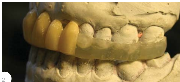
Рис.2. Каппа на верхнюю челюсть, стабилизирующая, релаксирующая, возмещающая включенный дефект в переднем участке верхней челюсти