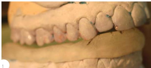
Рис.1. Оклюзионная каппа (шина) с передним и клыковым ведением нижней челюсти