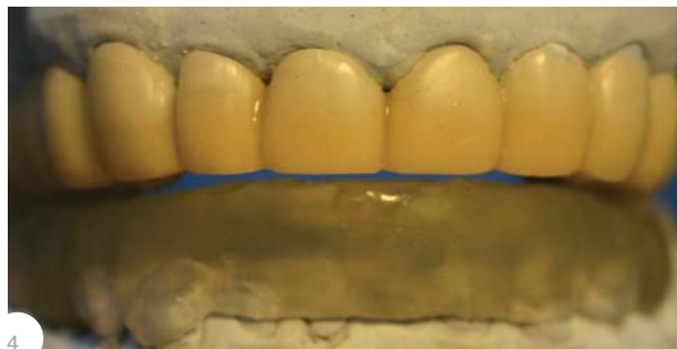
Рис.4. Временный мостовидный протез зубного ряда верхней челюсти и каппа комбинированного действия на зубной ряд нижней челюсти

подразделять на лечебные аппараты с контролируемой и неконтролируемой (непредсказуемой) окклюзионной схемой (соотношением челюстей).