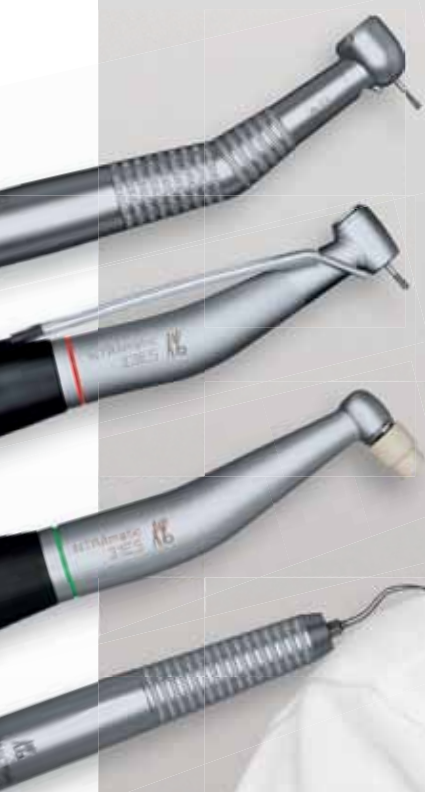
Турбина POWERtorque LUX 646 B